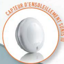
CAPTEUR D'ENSOLEILLEMENT SUNSIO

VOIETS ROULANTS, BRISE-SOLEIL ORIENTABLES, STORES, VELUX