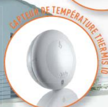
CAPTEUR DE TEMPÉRATURE THERMIO