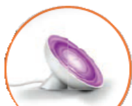
ECLAIRAGE IO ET PHILIPS HUE

Les équipements compatibles avec Connexoon Fenêtre