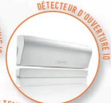
DÉTECTEUR D'OUVERTURE IO