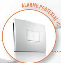
ALARME PROTEXIA IO

VOIETS ROULANTS, BRISE-SOLEIL ORIENTABLES, STORES, VELUX